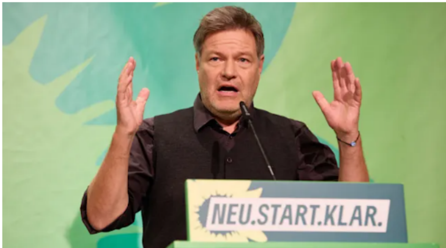
Will Kanzler werden: Wirtschaftsminister Robert Habeck (55)