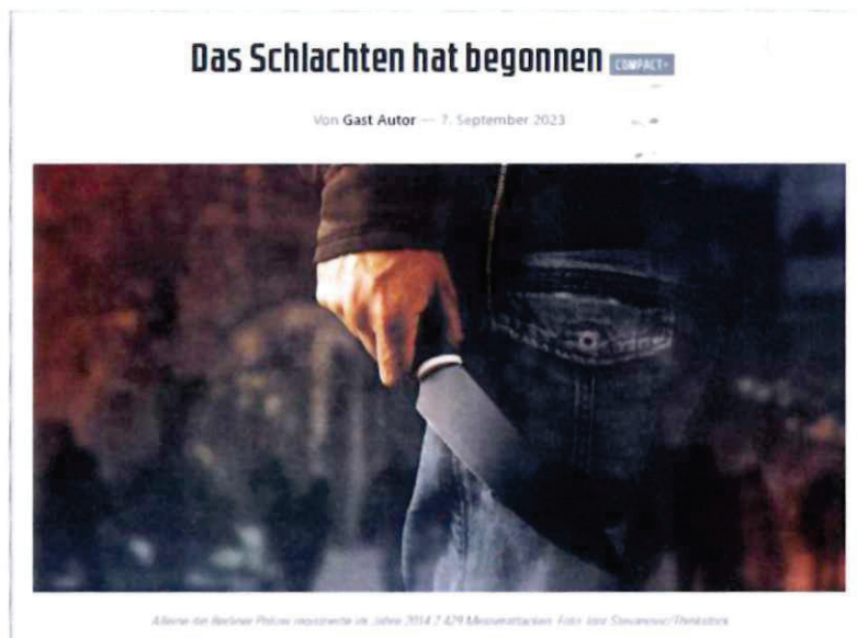
Abbildung 1 Online-Artikel vom 07.09.2023

„Ein Bürgerkrieg ist im Gange, ohne dass die Medien darüber berichten: Junge deutsche Männer werden von moslemischen Gleichaltrigen in immer größerer Zahl überfallen und ermordet.“