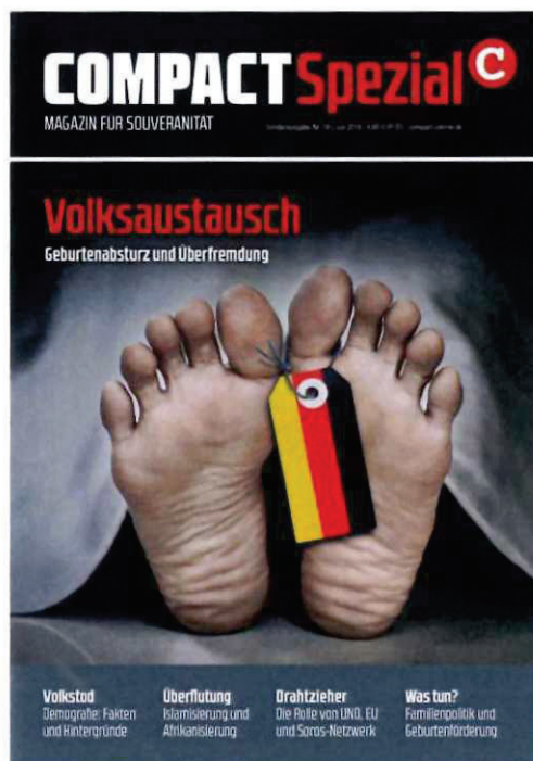
Abbildung 2 Cover COMPACT Spezial Nr. 18

die strukturelle Substitution der „autochthonen“ Bevölkerung durch Zuwanderer aus Afrika sowie dem Nahen und Mittleren Osten. Das Narrativ beruht auf der völkisch-ethnischen Vorstellung eines ethnisch homogenen deutschen Volkes. An die Stelle des ethnisch deutsch verstandenen Volks treten durch „Vermischung“ oder „Austausch“ Menschen anderer Ethnien, mit der Konsequenz, dass das ethnisch deutsche Volk in seiner Existenz untergeht. Innerhalb der Neuen Rechten wird diese Erzählung regelmäßig bewusst als ein von staatlichen Institutionen oder „Eliten“ gesteuerter Prozess bzw. Plan dargestellt. In der Konsequenz werden Menschen mit Migrationshintergrund pauschal als Invasoren und als Gefahr für die ethnisch deutsche Bevölkerung dargestellt und hierdurch herabgewürdigt.