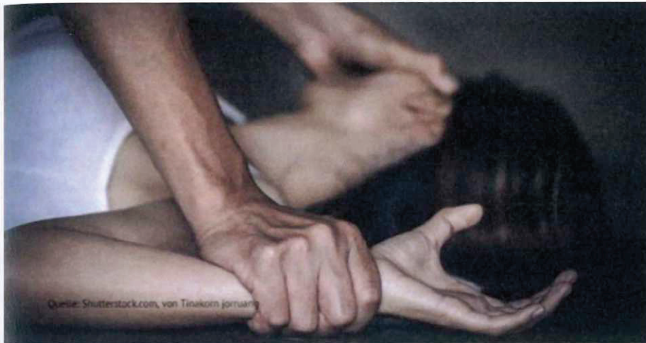
Enthemmte Gewalt gegen Frauen hat seit der Grenzöffnung 2015/2016 epidemische Ausmaße angenommen. Symbolbild Vergewaltigung.