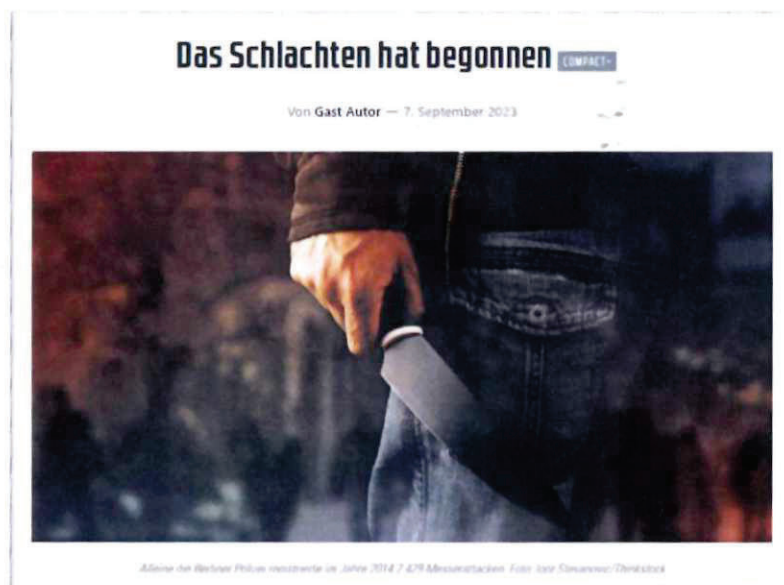
Abbildung 1 Online-Artikel vom 07.09.2023

„Ein Bürgerkrieg ist im Gange, ohne dass die Medien darüber berichten: Junge deutsche Männer werden von moslemischen Gleichaltrigen in immer größerer Zahl überfallen und ermordet.“