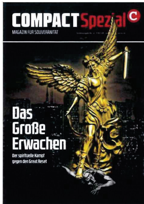
Abbildung 17 Cover COMPACT Spezial Nr. 32