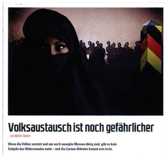
Abbildung 3 Bild + Überschrift Artikel COMPACT 7-2022

„Einig sind sich alle Formationen in der Politik des Great Reset: Volksaustausch durch Masseneinwanderung, [...]“