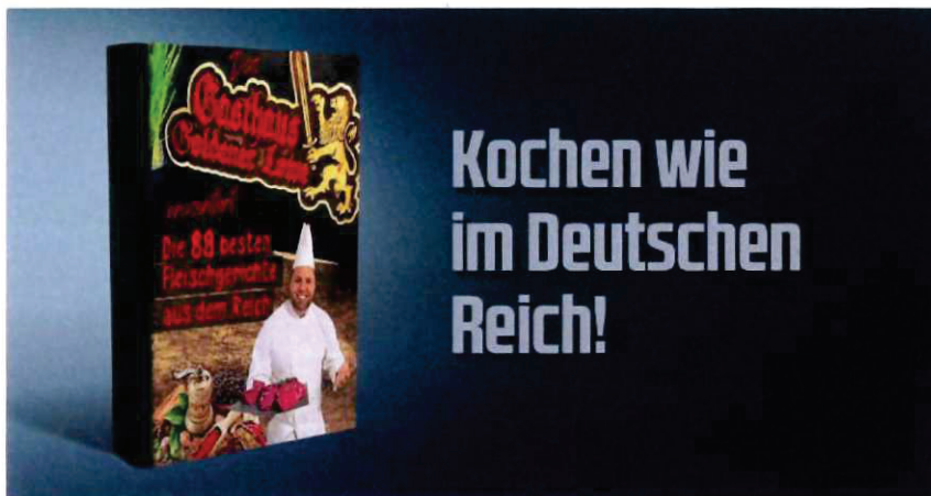
Abbildung 26 Werbebanner auf COMPACT-Online

„COMPACT“ vertreibt und bewirbt des Weiteren das Kochbuch „Die 88 besten Fleischgerichte aus dem Reich“ des Rechtsextremisten Tommy Frenck. Das Buch wird seitens „COMPACT“ als „Kult-Kochbuch“ bezeichnet. Auch wenn das Buch lediglich Kochrezepte beinhaltet, zeigt der Titel gleichwohl die rechtsextremistische Gesinnung, die hinter der Publikation steht. Der rechtsextremistische Code „88“, ersetzt den 8. Buchstaben im Alphabet, sprich HH, und steht für die verbotene Parole „Heil Hitler“. 26