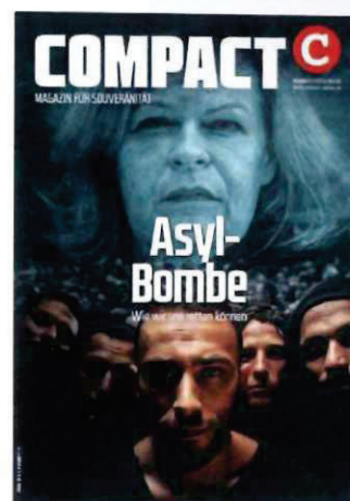
Abbildung 35 Cover COMPACT 11/23