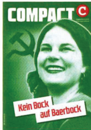
Abbildung 28 Cover COMPACT 6/21