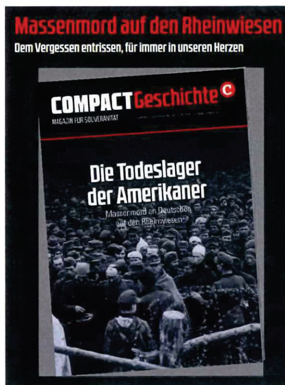
Abbildung 20 Werbeanzeige für COMPACT Geschichte Nr. 17 Abbildung 21 Werbeanzeige für COMPACT Geschichte Nr. 20

Auch mit Artikeln zur Waffen-SS oder der Leibstandarte verbreitet „COMPACT“ NS-relativierende und geschichtsrevisionistische Inhalte. So werden mittels einzelnen Zeitzeugenberichten die Taten der Waffen-SS oder Leibstandarte relativiert oder verherrlicht. Angehörige der Waffen-SS werden beispielsweise als die „ Tapfersten der Tapferen “ oder „ Tapfere Soldaten, keine Verbrecher “ bezeichnet.