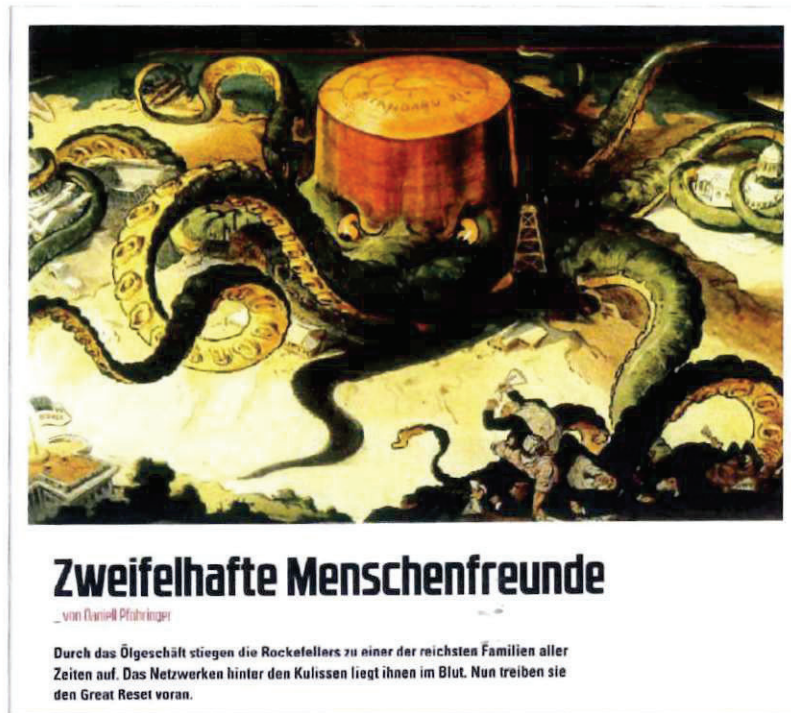
Abbildung 14 Abbildung in COMPACT Spezial Nr. 30