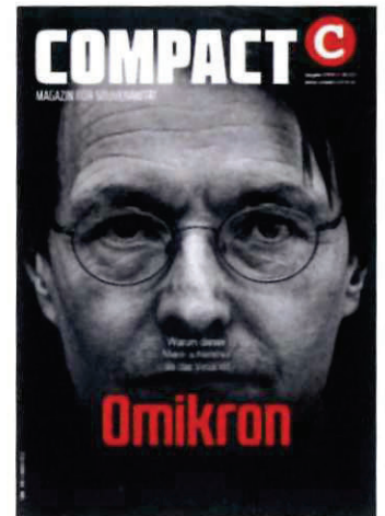
Abbildung 29 Cover COMPACT 2/22