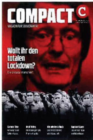
Abbildung 27 Cover COMPACT 2/21

Unterlagen nach § 8a Abs. 1 und/oder 2 BVerfSchG G10