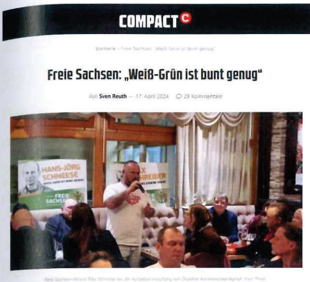
Abbildung 24 Artikel auf Compact-online über die Freien Sachsen

Unterlagen nach § 8a Abs. 1 und/oder 2 BVerfSchG G10