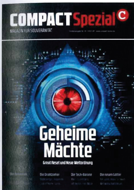
Abbildung 16 Cover COMPACT Spezial Nr. 30

Ursprünglich stammt die Formulierung „Great Reset“ von einer Initiative des Weltwirtschaftsforums WEF, ökonomische Reformen für mehr Nachhaltigkeit und soziale Partizipation durchzuführen. Das WEF und dessen Vorsitzender Klaus Schwab werden daher als antisemitische Chiffren genutzt. „COMPACT“ stellt das antisemitische Verschwörungsnarrativ in den Fokus von zwei veröffentlichten Sonderheften, „COMPACT Spezial“ Nr. 30 „Geheime Mächte. Great Reset und Neue Weltordnung“ und „COMPACT Spezial“ Nr. 32 „Das große Erwachen. Der spirituelle Kampf gegen den Great Reset“ sowie dem Monatsmagazin „COMPACT“ Nr. 4 mit dem Titel „Great Reset – Die teuflischen Pläne der globalen Elite“.