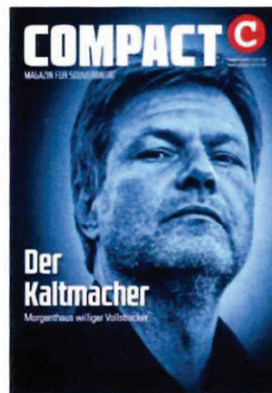
Abbildung 31 Cover COMPACT 8/22