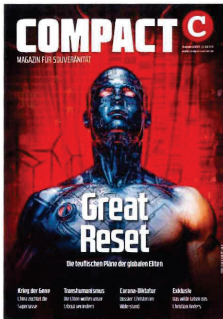
Abbildung 18 Cover COMPACT 4-21

Auch in weiteren Veröffentlichungen wird behauptet, dass ein „Great Reset“ stattfindet und auf das WEF und Klaus Schwab verwiesen: