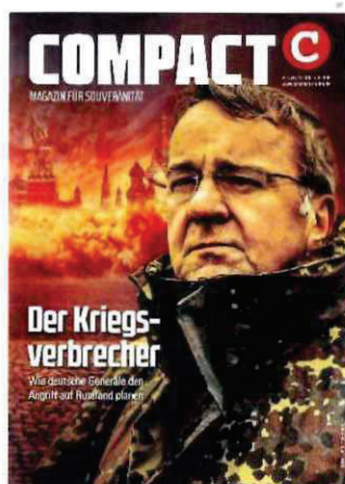
Abbildung 37 Cover COMPACT 4/24