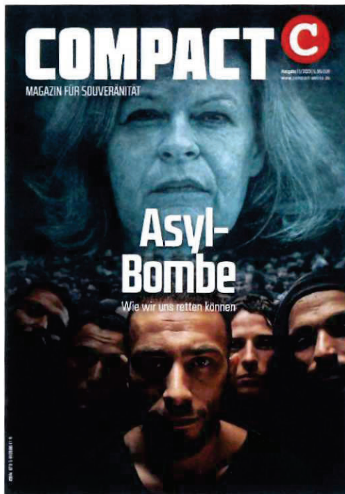
Abbildung 4 Cover COMPACT 11-2023