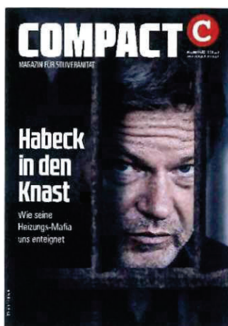
Abbildung 345 Cover COMPACT 6/23