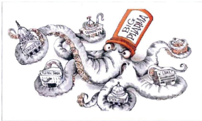
Abbildung 15 Abbildung in COMPACT Spezial Nr. 30