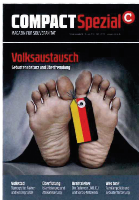
Abbildung 2 Cover COMPACT Spezial Nr. 18

die strukturelle Substitution der „autochthonen“ Bevölkerung durch Zuwanderer aus Afrika sowie dem Nahen und Mittleren Osten. Das Narrativ beruht auf der völkisch-ethnischen Vorstellung eines ethnisch homogenen deutschen Volkes. An die Stelle des ethnisch deutsch verstandenen Volks treten durch „Vermischung“ oder „Austausch“ Menschen anderer Ethnien, mit der Konsequenz, dass das ethnisch deutsche Volk in seiner Existenz untergeht. Innerhalb der Neuen Rechten wird diese Erzählung regelmäßig bewusst als ein von staatlichen Institutionen oder „Eliten“ gesteuerter Prozess bzw. Plan dargestellt. In der Konsequenz werden Menschen mit Migrationshintergrund pauschal als Invasoren und als Gefahr für die ethnisch deutsche Bevölkerung dargestellt und hierdurch herabgewürdigt.