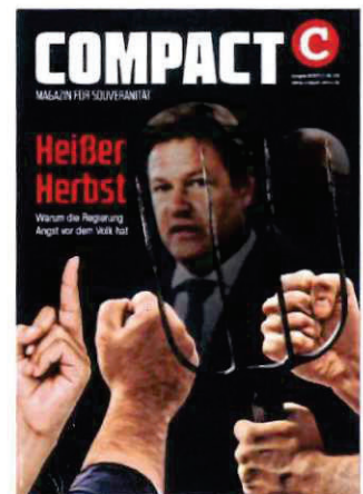
Abbildung 32 Cover COMPACT 9/22