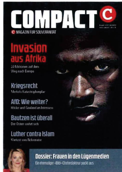
Abbildung 5 Cover COMPACT 10-2016

„Die Flüchtlingskrise von 2015 darf sich nicht wiederholen. Doch die Realität sieht anders aus: Der Asyl-Tsunami wiederholt sich gerade – und könnte in diesem Jahr sogar noch drastischer ausfallen.“