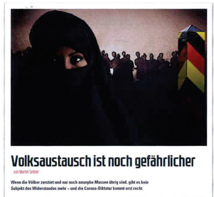
Abbildung 3 Bild + Überschrift Artikel COMPACT 7-2022

„Einig sind sich alle Formationen in der Politik des Great Reset: Volksaustausch durch Masseneinwanderung, [...]“