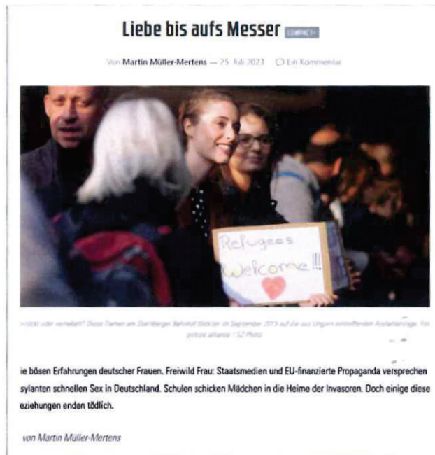
Abbildung 9 Online-Artikel vom 25.07.2023

schnellen Sex in Deutschland. Schulen schicken Mädchen in die Heime der Invasoren. Doch einige dieser Beziehungen enden tödlich.“