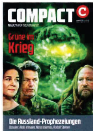
Abbildung 30 Cover COMPACT 6/22