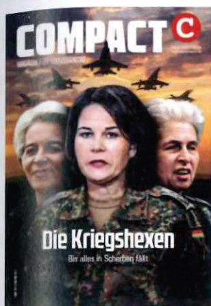
Abbildung 33 Cover COMPACT 3/23

Unterlagen nach § 8a Abs. 1 und/oder 2 BVerfSchG G10