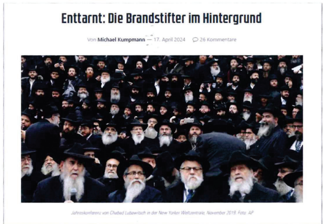
Abbildung 41 Screenshot COMPACT-Online

In einem Online-Artikel vom 17. April 2024 verbreitet „COMPACT“ das Narrativ, die jüdische Gemeinschaft Chabad Lubawitsch arbeite im Hintergrund auf beiden Seiten des russischen Angriffskrieges in der Ukraine an einer Eskalation des militärischen Konflikts.