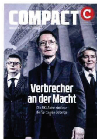
Abbildung 38 Cover COMPACT 5/24

Die daraus und aus den im Kapitel III. A 1. dargelegten Inhalten erwachsende Delegitimierung des demokratischen Systems wird mit verschwörungstheoretischen Narrativen in einen direkten Sachzusammenhang einer „Umvolkung“ und eines „Bevölkerungsaustausches“ gebracht. Ebenso verhält es sich mit den durch „COMPACT“ verbreiteten und ebenfalls im Kapitel III. A 1. aufgezeigten Positionen gegen insbesondere arabischstämmige Menschen, Migranten, „Fremde“ oder Juden. Die hiervon ausgehende Gefahr ist mit Blick auf die zahlreichen diffamierten Personen und Personengruppen, die fortlaufend dieser Agitation ausgesetzt sind, und die daraus