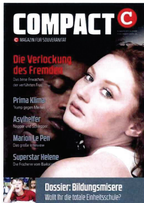
Abbildung 8 COMPACT 07-2017

In einem auf „COMPACT-Online“ im Juli 2023 erneut veröffentlichten Artikel heißt es in der Artikelüberschrift: