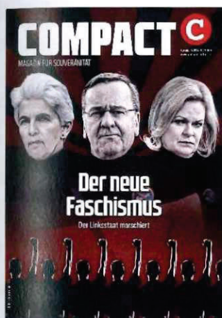
Abbildung 36 Cover COMPACT 3/24