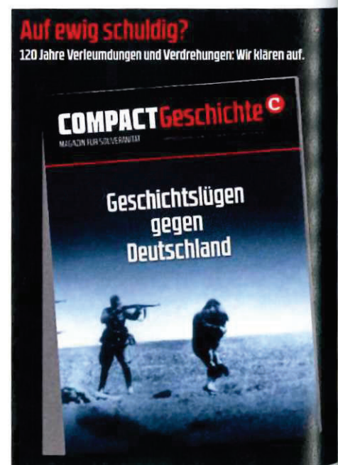
Abbildung 19 Werbeanzeige für COMPACT Geschichte 13

Auch in den Ausgaben „COMPACT Geschichte“ Nr. 13 mit dem Titel: „Geschichtslügen gegen Deutschland“, Nr. 17 mit dem Titel: „Polens verschwiegene Schuld. Verbrechen an Deutschen von Versailles bis zur Vertreibung“ und Nr. 20 mit dem Titel: „Die Todeslager der Amerikaner. Massenmord an Deutschen auf den Rheinwiesen“ verbreitet „COMPACT“ ein revisionistisches Bild. Die beispiellosen Verbrechen des NS-Regimes werden von „COMPACT“ relativiert, indem Verbrechen anderer Staaten angeführt und gleichgestellt werden.