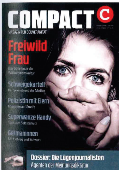
Abbildung 7 Cover COMPACT 2-2016

Migranten werden seitens „COMPACT“ insbesondere als Gefahr für Frauen und Mädchen in Deutschland stigmatisiert. Dies zeigt sich in der Bildgestaltung und Textinhalten von „COMPACT“: